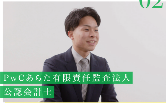
PwCあらた有限責任監査法人 公認会計士