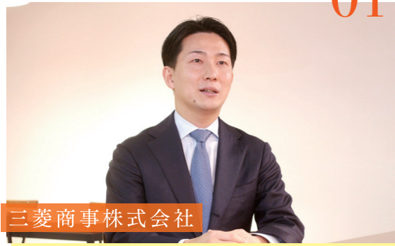
三菱商事株式会社