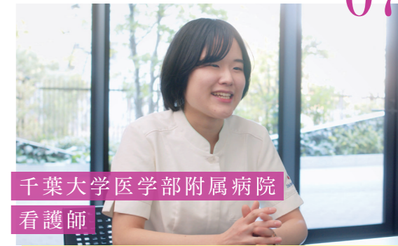
千葉大学医学部附属病院 看護師