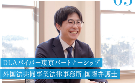
DLAパイパー東京パートナーシップ 外国法共同事業法律事務所 国際弁護士