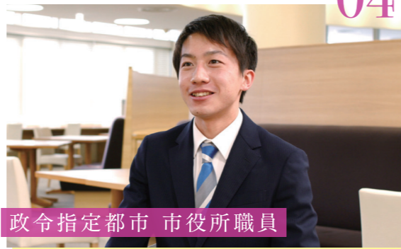
政令指定都市 市役所職員