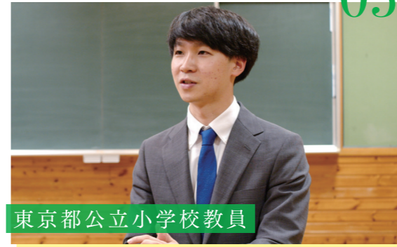
東京都公立小学校教員