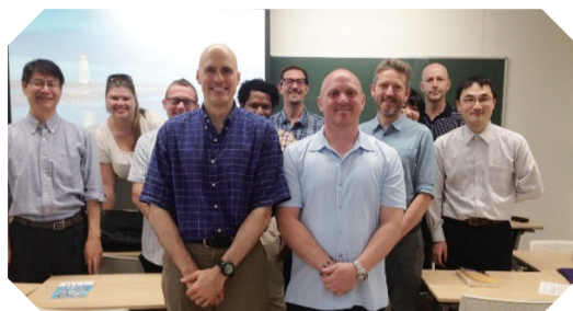
終了後、WLC FD講師・参加者全員で記念撮影

その後、学生一人一人が21世紀の職場でより豊かに生きるために必要なスキルとは何か、という問いに答えるリストを参加者が話し合っって作成しました。講師は先行研究から得られたリストを発表し、学生のスキル習得を促進するための具体的な方策を紹介して、教員の教育力向上に多に貢献するFDセミナーとなりました。