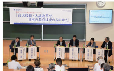
第2部 パネルディスカッション