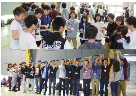
PAによる仲間づくり

なお、「経営基礎演習」の授業では、事前研修を受けたSA (Student Assistant) がすべてのクラスにサポートとしてついていきます。また、同科目の授業内に、学生の主体性と協調性を引き出すために、SAが主導し、プロジェクト・アドベンチャー (PA) の手法を用いて仲間づくりを行いました。