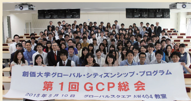
総会終了後に記念撮影

GCP総会は、今後毎年2回開催されることを予定しており、「第2回GCP総会」は11月8日に行なわれ、多くの卒業生、現役生が集いあいました。GCP総会は、GCP生の学びの目的を確認し、不断の努力を決意しあう場となることでしょう。GCP総会の参加を節目としつつ、一層のGCP生の活躍が期待されます。