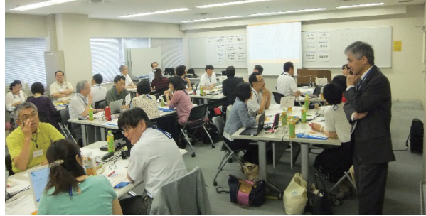
研修におけるグループワーク

授業改善で困っているところについて、具体的な改善案を見いだすことができた。」「最後のプレゼンでは大変に触発をうけた。今後の授業改善に活かしたい。」「アクティブ・ラーニングの可能性を知ることが出来た。特に学びの深さに活動的・非活動的であるかは関係ないことがわかった。」などの感想がありました。