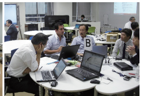
振り返り研修 (9月9日)