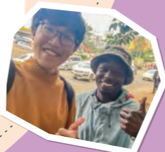
Study in Mexico