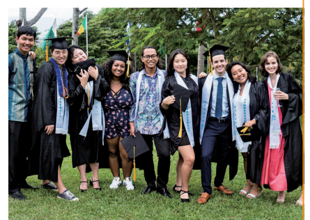
海外大学院修了式にて

GCPの仲間との努力や挑戦の日々は、私の生涯の宝です。みなさんもGCPで、大きく世界に羽ばたく学びの日々を送ってみませんか？