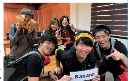
海外研修の一コマ

将来、国際的に活躍する弁護士を目指して世界で通用する力を磨こうとGCPに入りました。GCPでは「英語を学ぶ」と同時に、世界の諸問題について「英語で学ぶ」ことができます。テストのための勉強だけではなく、ディスカッションやエッセイを通して英語で世界の問題を理解し、解決について考え、英語で発信することが求められます。大変な日々でしたが、様々な学部から集った意識の高いGCPの仲間と励ましあって、取り組むことができました。みなさんと共に学びあえる日を、心待ちにしています。