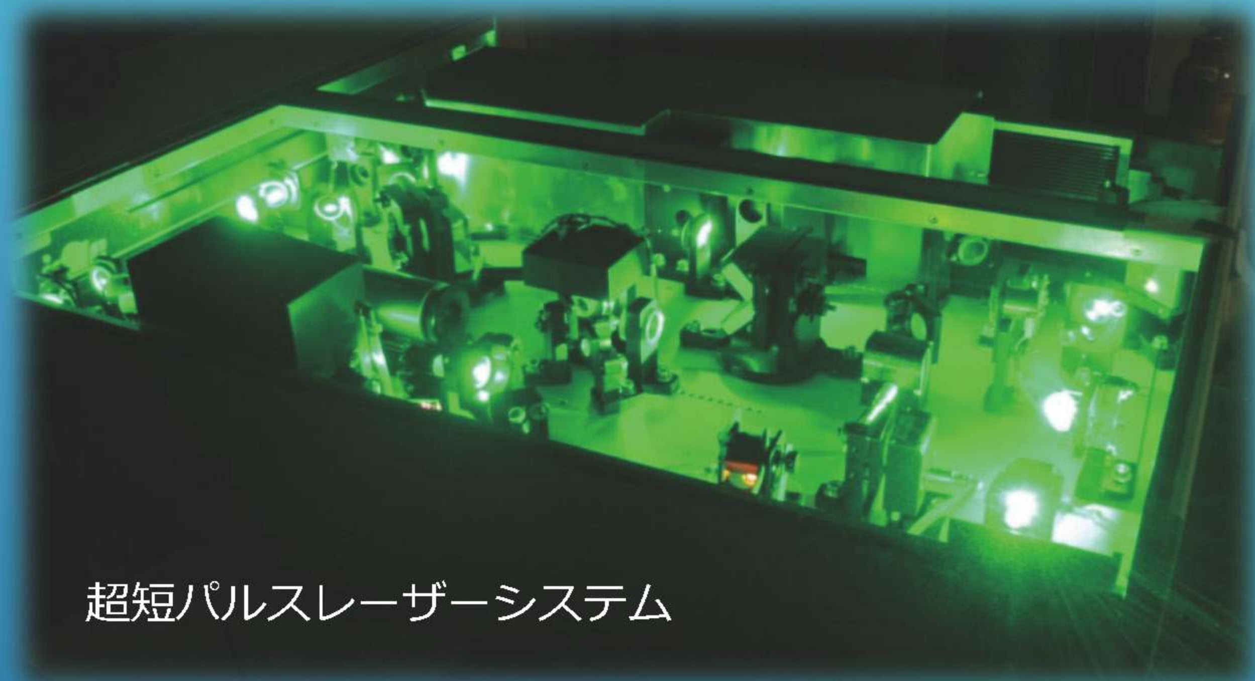
超短パルスレーザーシステム