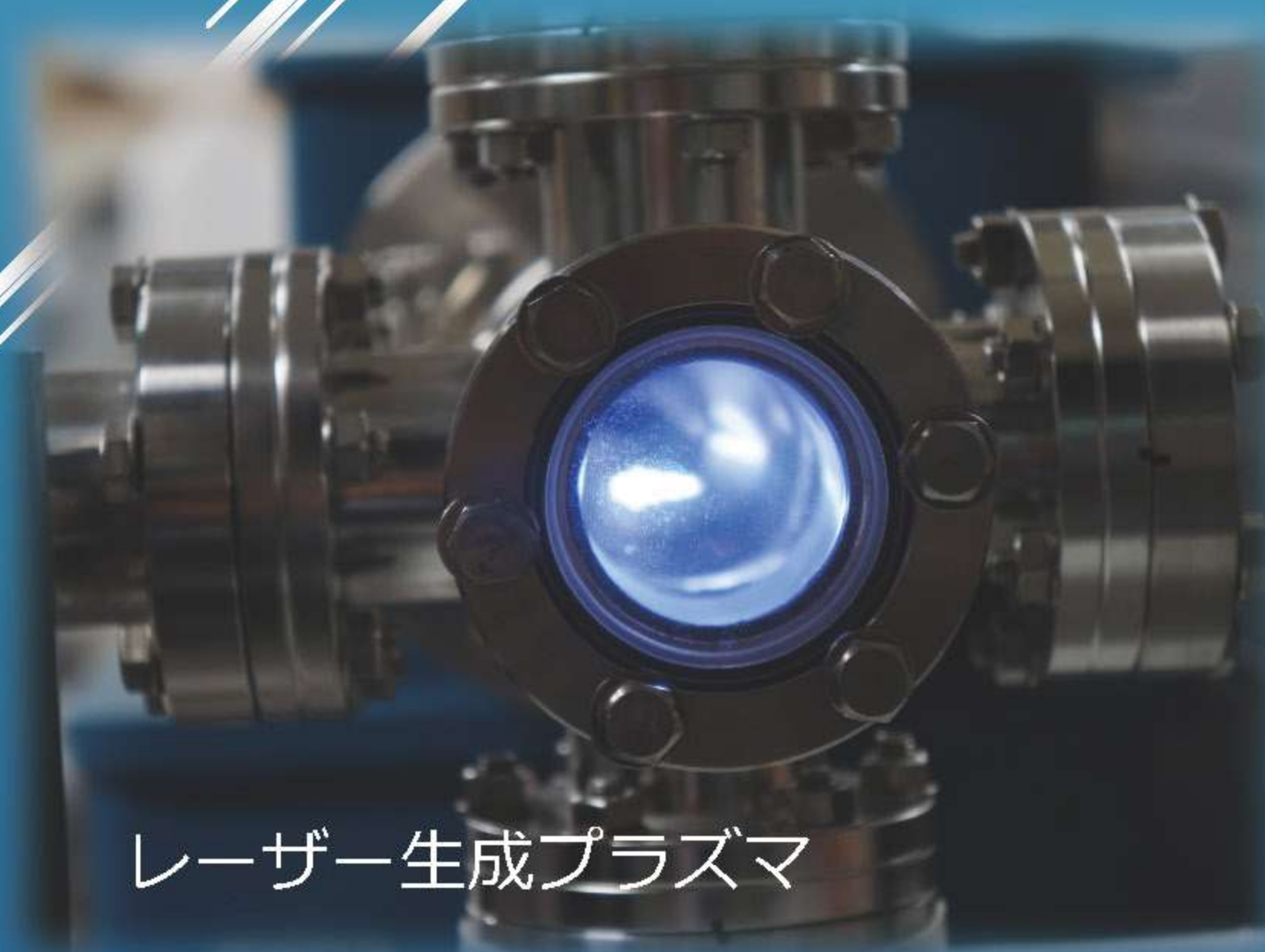
レーザー生成プラズマ