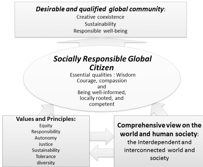
Table2 Comprehensive framework of understanding of a socially responsible global citizen (composed by the author)

The second domain is on the core values and principles in the global age majorly represented by responsibility, equity, justice, autonomy, and tolerance.