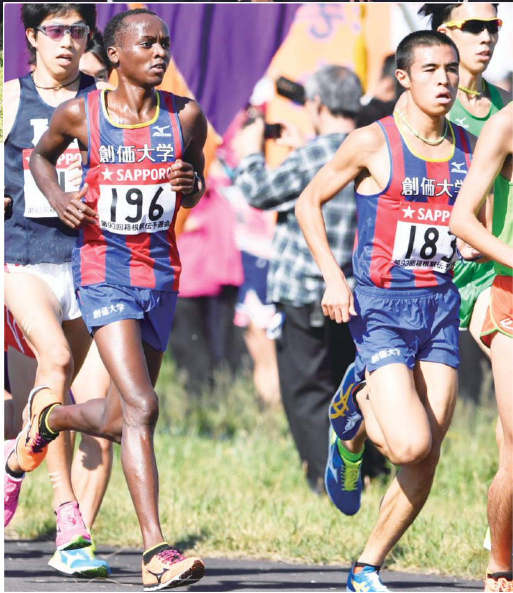
第一集団で力走するセルナルド(右)とマイル(左) 4位(44分03秒)に順位を上げ、そのままゴール。58分51秒は全体4位だった。もちろん、マイルの好タイムは創価大学にとって大きかったが、予選会はチーム総合タイムで争うため、1人だけ上位フィニッシュではダメなのだ。実際、好タイムを出した選手がいなくても、本選出場を逃した大学はいくつもあつた。それだけ集団の走り光った。

創価大学陸上競技部駅伝部が10月15日(土)に行われた第93回箱根駅伝予選会に出場、3位の好成績で見事2年ぶり2回目の本大会(2017年1月2、3日開催)への出場権を手に入れた。 予選会は1校12選手が出場し、上位10選手の総合タイムで順位が決まる。今年は50校が出場し、新春の箱根駅伝に出場できるのは予選会から10校だけ。創価大のチーム成績は5ギ通(29分24秒)で通過すると、15ギ地点では4位(44分03秒)に順位を上げ、そのままゴール。58分51秒は全体4位だった。もちろん、マイルの好タイムは創価大学にとって大きかったが、予選会はチーム総合タイムで争うため、1人だけ上位フィニッシュではダメなのだ。実際、好タイムを出した選手がいなくても、本選出場を逃した大学はいくつもあつた。それだけ集団の走り光った。