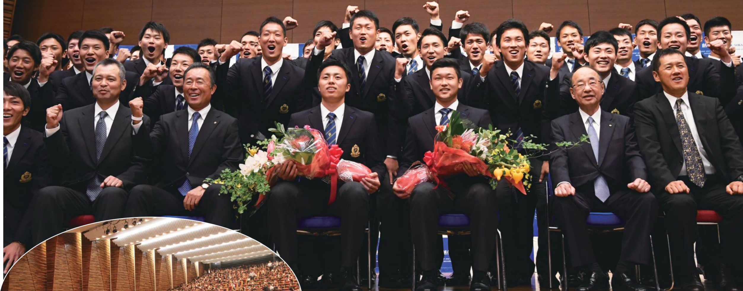
会場に51社143名の取材陣と1300名の学生ら殺到