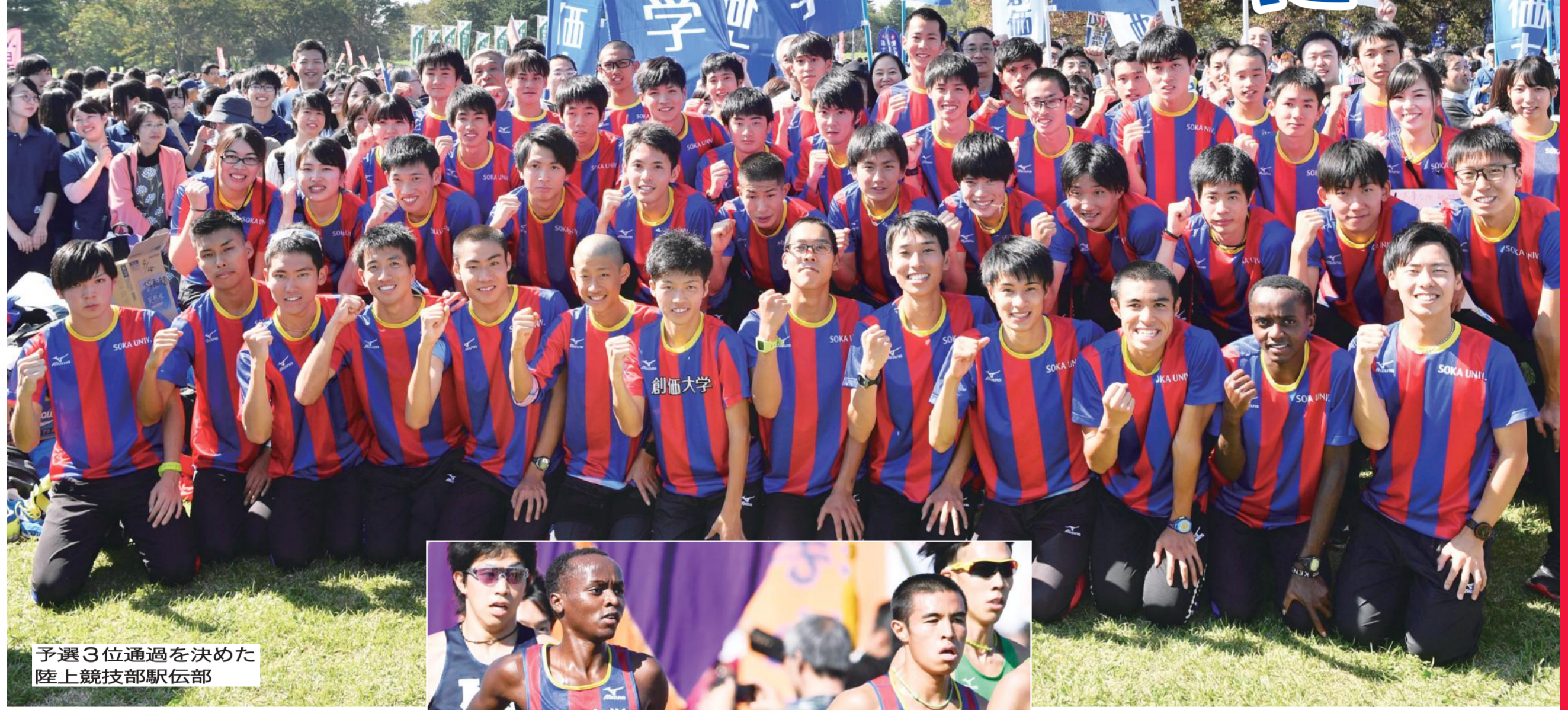
予選3位通過を決めた 陸上競技部駅伝部