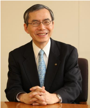
소카대학교 총장 바바 요시히사

'인간교육의 최고 학부이어라' '새로운 대문화 건설의 요람이어라' '인류의 평화를 지키는 요새이어라' 이와 같은 건학 정신 아래 창립된 소카대학교는 2021년에 50주년을 맞이합니다. 창립 50주년, 또 앞으로 10년을 향해 대학의 그랜드 디자인(장대한 구상)을 책정했습니다.