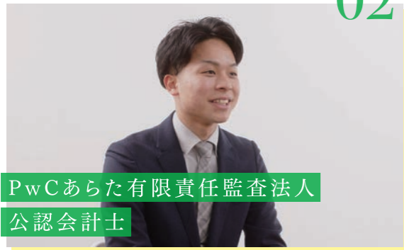
PwCあらた有限責任監査法人 公認会計士