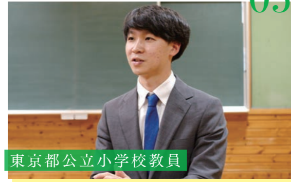
東京都立小学校教員