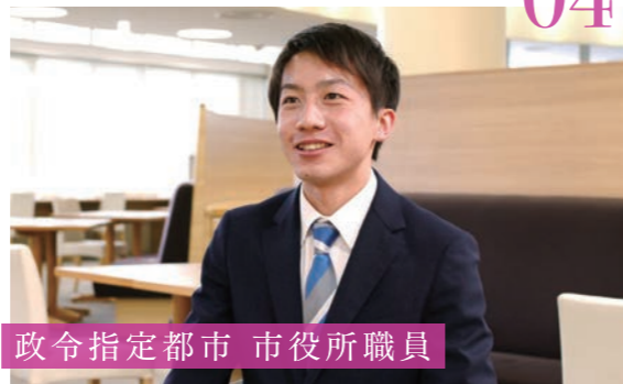
政令指定都市 市役所職員