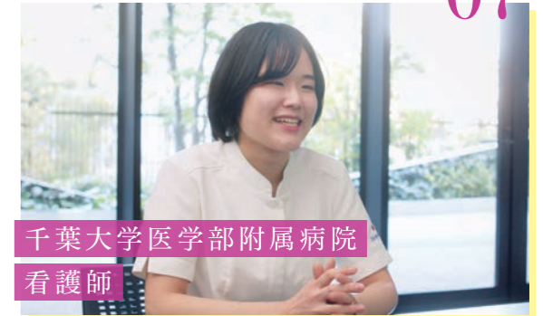
千葉大学医学部附属病院 看護師