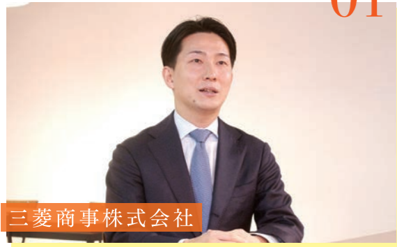
三菱商事株式会社