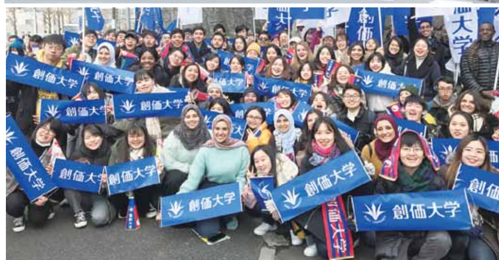
留学生たちも笑顔で応援