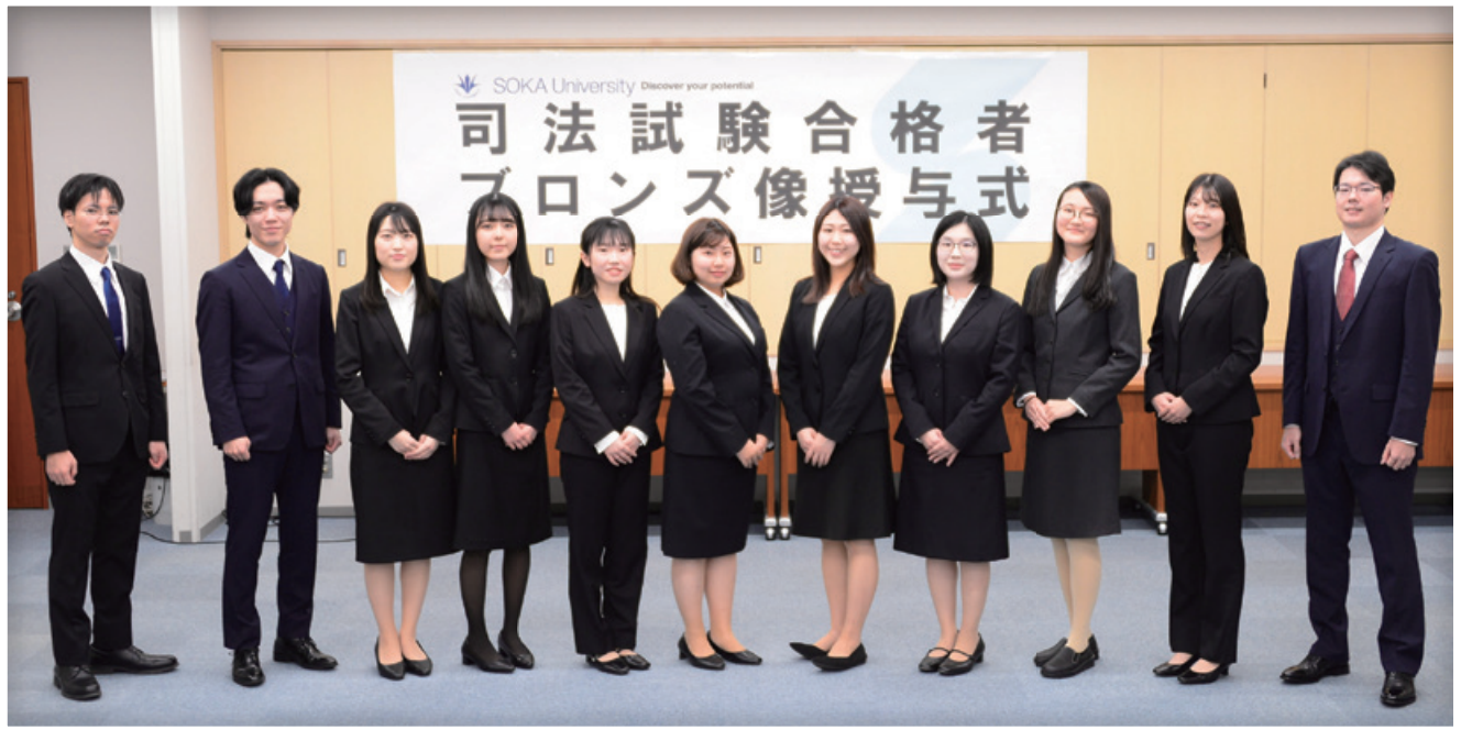
2023年司法試験合格者