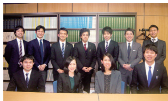
学修をサポートするチューター